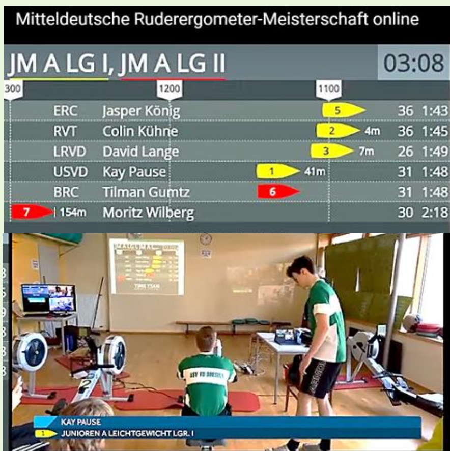
Kay Pause fuhr in seinem hoch-spannenden 2 000 m-Lauf mit ständigen „Bugballwechsel“ mit seinem Laubegaster Konkurrenten um Platz 3 und musste sich doch undankbar mit 0,1 Sekunde mit dem 4. Platz im Ziel begnügen