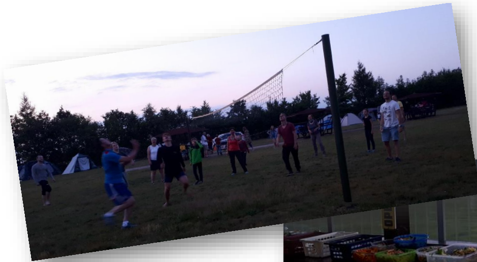
Sport und Spiel